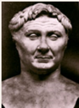
Pompeu O Grande

Quando o general romano, Pompeu, entrou triunfantemente em Jerusalém, no primeiro século d.C., ele estava determinado a satisfazer sua curiosidade sobre certas histórias que circulavam em torno do mundo mediterrâneo acerca da adoração do povo judaico. Depois de conquistar esta cidade, tornou-se uma de suas prioridades pessoais subir ao Monte do Templo e